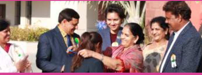
एथलेटिक्स प्रतियोगिता में स्वर्ण व कांस्य पदक विजेता पुरस्कृत