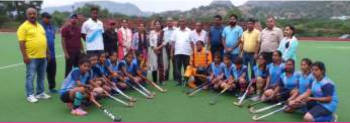
33वीं अंतर महाविद्यालयी हॉकी प्रतियोगिता, म.द.स.विश्वविद्यालय, अजमेर फाईनल मैच, चन्द्रवरदाई स्टेडियम, अजमेर