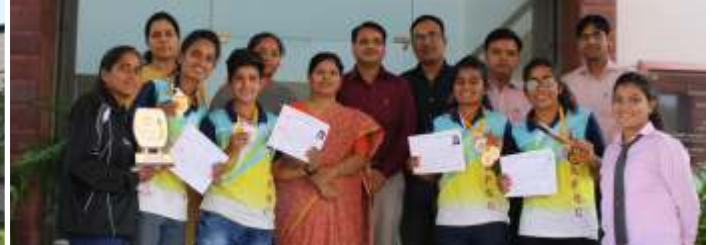
33वीं अंतर महाविद्यालयी लॉन टेनिस प्रतियोगिता म.द.स.विश्वविद्यालय, अजमेर आयोजन स्थल श्री आर.के. पाटनी गर्ल्स कॉलेज, किशनगढ़