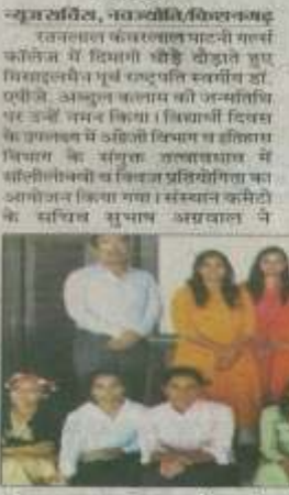
किशनगर | आरके पाटनी गर्ल्स कॉलेज में कार्यक्रम

मिसाइलमैन एवं राष्ट्रपति आभ्यास का रोमांचक कार्यक्रम छात्राओं को आरके गर्ल्स कॉलेज में आयोजित किया गया। कार्यक्रम में छात्राओं को मिसाइलमैन के बारे में जानकारी दी गई। छात्राओं को मिसाइलमैन के बारे में जानकारी दी गई। छात्राओं को मिसाइलमैन के बारे में जानकारी दी गई।