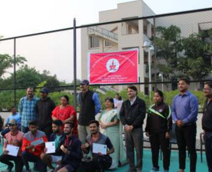
33वीं अंतर महाविद्यालयी लॉन टेनिस प्रतियोगिता