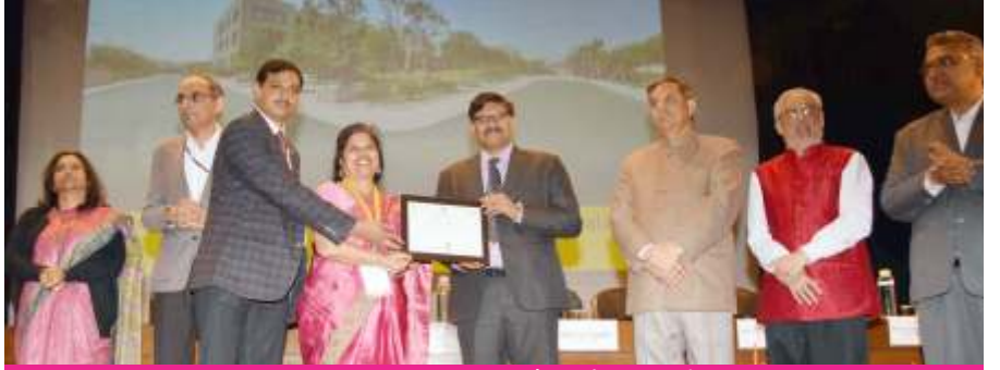
• मानव संसाधन विकास मंत्रालय द्वारा स्वच्छता रैंकिंग में मिला चतुर्थ स्थान •