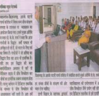
डिजिटल तकनीक से समझे जीव विज्ञान