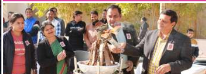
वार्षिक खेलकूद उद्घाटन समारोह